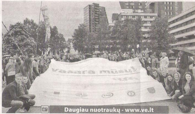
Daugiau nuotraukų - www.ve.lt

Klaipėdos miesto savivaldybės Atviros erdvės jaunimo centras ir Klaipėdos apskrities vyriausiasis policijos komisariatas bei daugybė kitų įstaigų ir