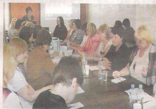
■ Конференция: учителя русского языка собрались, чтобы обсудить новые методики преподавания, новые формы урока и рассказать об успехах своих учеников.

Вся работа учителя русского языка сегодня направлена на то, чтобы русскоязычный ребенок не только хорошо знал свой язык, литературу, культуру, но и мог на этом языке быть услышанным, мог получить образование; чтобы русский язык стал языком достижения русской культуры для детей литовской национальности, чтобы он стал языком созидания, творчества и дружбы.