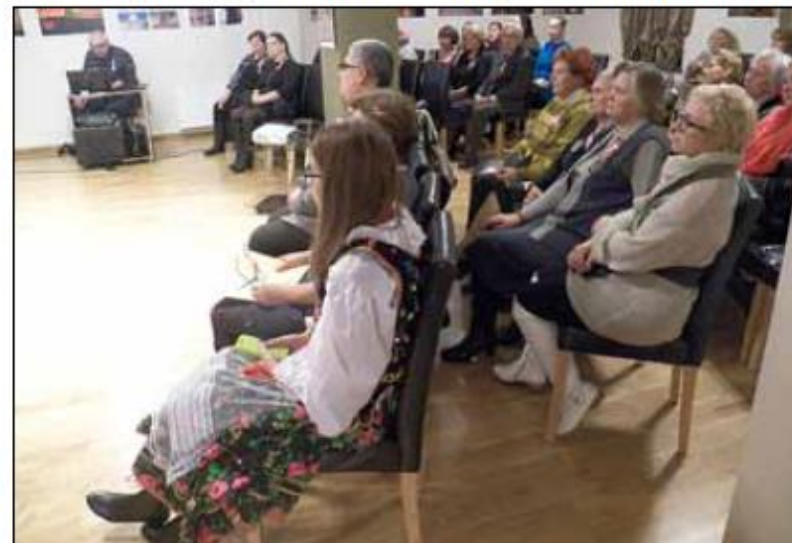
Świąteczne, niepodległościowe spotkanie w Domu Mniejszości Narodowych w Kłajpedzie