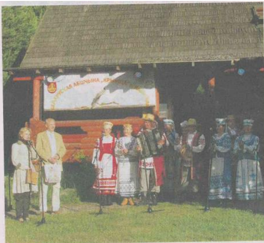
■ Радость: народные традиции нашли свое место на этом празднике.