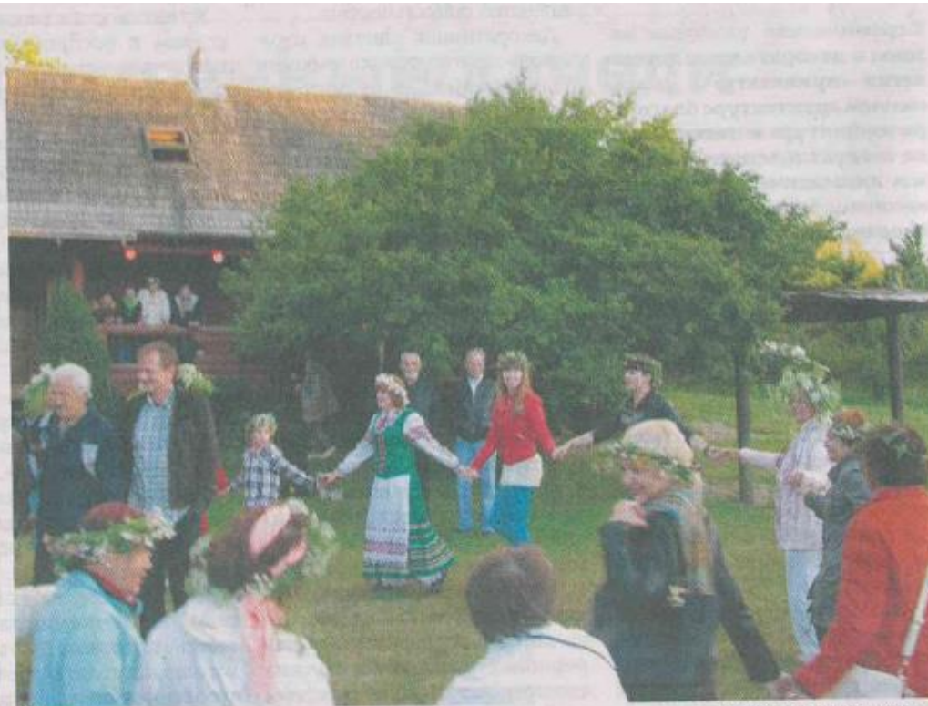
■ Родина: во время концерта все зрители, несомненно, почувствовали чарующий голос Беларуси.