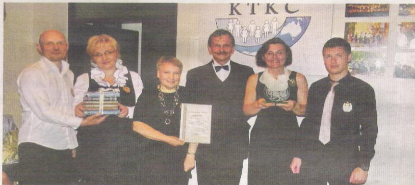
■ Игра: призы и памятные подарки получены. Фотографии на память сделаны.

Разминка «Медиавикторина». Страсти накаляются. «Своя игра». Горячие головы, стоит ли рисковать? Перерыв – и так приятно пройти по дворику, слушая Моцарта в исполнении струнного квартета. И вот она, большая игра «Что? Где? Когда?». Вопро-