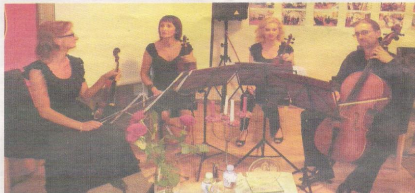
■ Мастерство: живая классическая музыка в исполнении Клайпедского струнного квартета придавала поединку знатоков особую торжественность.